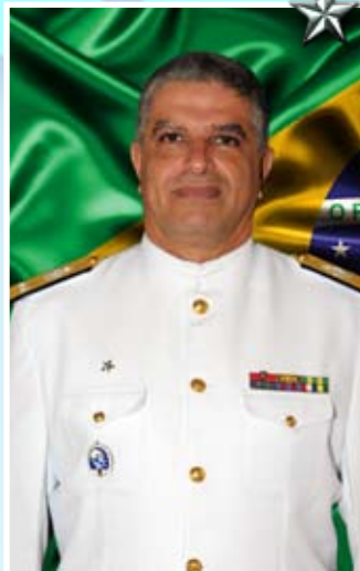
Contra-Almirante Rodolfo Frederico Dibo

★ ★ O Contra-Almirante Rodolfo Frederico Dibo é natural do Rio de Janeiro. Foi declarado Guarda-Marinha em 13 de dezembro de 1980.