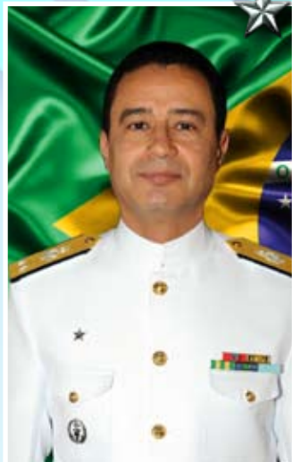
Contra-Almirante Almir Garnier Santos

★ ★ O Contra-Almirante Almir Garnier Santos é natural do Rio de Janeiro. Foi declarado Guarda-Marinha em 13 de dezembro de 1981.