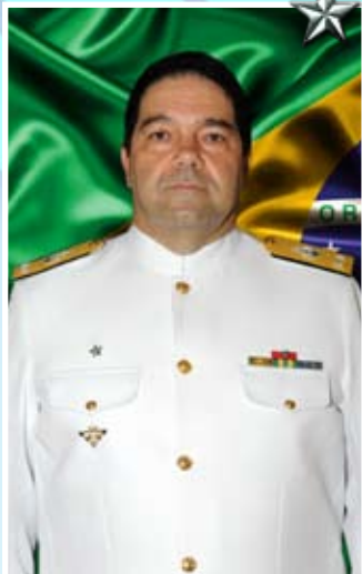
Contra-Almirante Rodolpho Arpon Marandino

O Contra-Almirante Rodolpho Arpon Marandino é natural do Rio de Janeiro. Foi declarado Guarda-Marinha em 13 de dezembro de 1980.